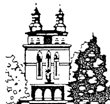
St. Laurentius Heiligenwald