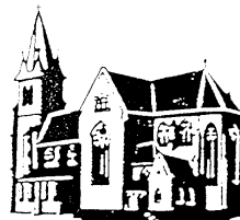
Herz Jesu Landsweiler-Reden