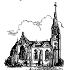
St. Martin Schiffweiler