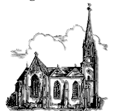
St. Martin Schiffweiler