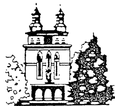
St. Laurentius Heiligenwald