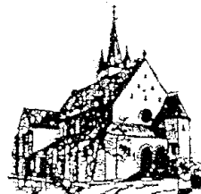
St. Barbara Stennweiler

14., 15., 16., 17. und 18. Sonntag im Jahreskreis